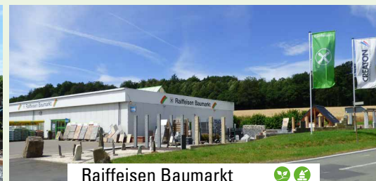
Raiffeisen Baumarkt Ottrau