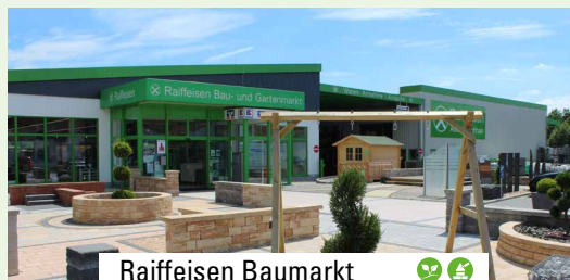
Raiffeisen Baumarkt Homberg/Ohm