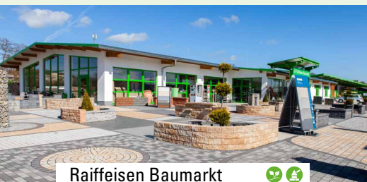
Raiffeisen Baumarkt Alsfeld