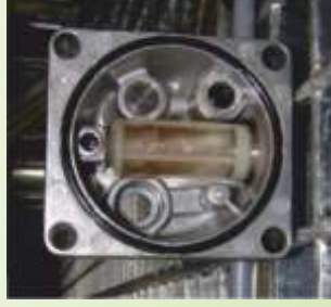
Heizölpumpe mit Standard-Heizöl