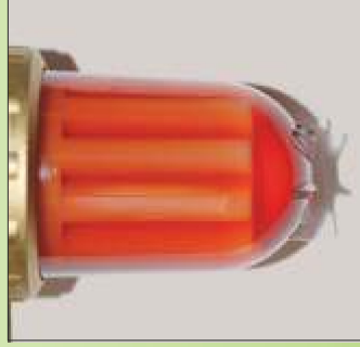
Raiffeisen Spar-Heizöl im gealterten Zustand (ca. 1 Jahr)