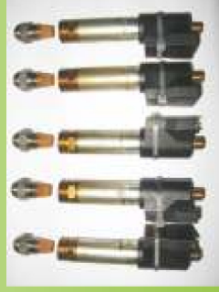
Mit Raiffeisen Spar-Heizöl