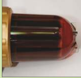
Standard-Heizöl im gealterten Zustand (ca. 1 Jahr)

Raiffeisen Spar-Heizöl sorgt nicht nur für einen besseren Wärmeübergang, es werden darüber hinaus bereits bestehende Ablagerungen abgebaut.